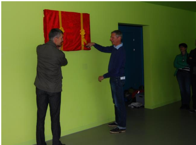
Abbildung 3: Enthüllung der Anzeigetafel

Nach der gelungenen Einweihungsfeier der Photovoltaik-Anlage im Mai gilt es nun einzelne vom eidgenössische Starkstrominspektorat ESTI festgestellte Mängel noch zu beheben. Die Internetverbindung für die Fernüberwachung gestaltet sich zurzeit schwieriger als erwartet. Wir hoffen, hier bald eine vernünftige Lösung aufzeigen zu können. Weiter ist die von uns nach der Einweihungsfeier aufgeschaltete Webseite zu aktualisieren und zu ergänzen ( www.energie-buttisholz.ch ).