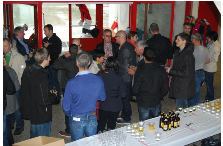
Abbildung 4: Angeregte Diskussionen bei Wurst und Brot

In der zweiten Jahreshälfte hoffen wir, dass uns der Wettergott gut gelaunt ist und die Bedingungen für eine ideale Produktion gegeben sind. Wir wünschen euch allen eine schönen Herbst und die Zeit für Spaziergänge durch die bunt gefärbte Landschaft.