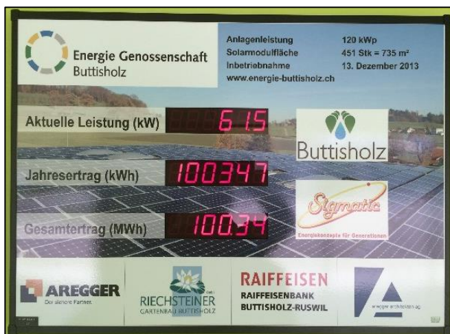
Abbildung 1: Anzeigetafel Stand 25.08.2014

Wie auf der Anzeigetafel zu entnehmen ist, wurden vom Dezember 2013 bis August 2014 etwas über 100'000kW/h Strom produziert. Vergleicht man die Halbjahreszahlen Januar bis Juni 2014, so stellen wir mit Freuden fest, dass die Anlage rund 14'000kW/h mehr produziert hat, als die Prognosen der Sigmatic vorgaben. Also rund 71'000kW/h anstelle von 57'000kW/h.